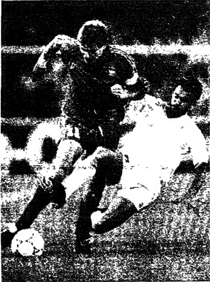
كوليمانز يحاور دوغو دو ليون